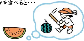
保育園でのすいか割りを思い出す