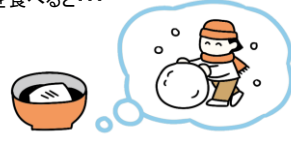
雪遊びを思い出す