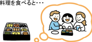
家族で過ごしたお正月を思い出す