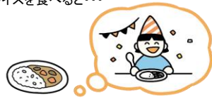
保育園の誕生日会を思い出す