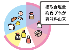
厚生労働省 令和元年 国民健康・栄養調査より作成

日本人が摂取している塩分のうち、調味料由来が67%となっています。減塩するには、「調理に使う調味料」、また「料理にかける食卓調味料」を減らすことが有効です。子どもが好きなマヨネーズ、ドレッシング、ケチャップ、ソースの使い過ぎには注意しましょう。