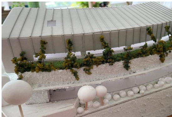
☆園庭東門付近、歩道上からのイメージ。2階バルコニーは全面屋上緑化。1階はテラスの付いた全面ガラス張りです。※右側の写真は、絵本とおもちゃ棚のイメージです。この大きな棚がW字の形で保育室の壁面になります。