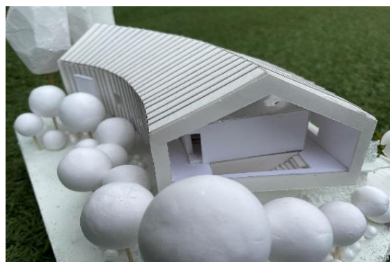
※2階ホールの両側面は全面ガラス張りです。