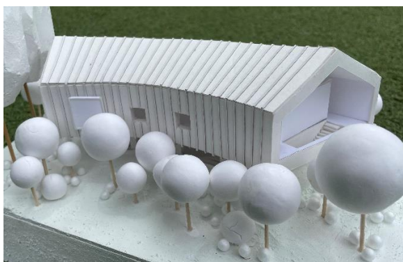
☆園庭よりのイメージ (球体は樹木のイメージ、ホール左側はメタセコイヤの並木)

一階が子育て支援のスペースで、絵本棚・おもちゃ棚を壁面に2つの空間に分かれ、ナースリークラス・預かり保育に主に使用する事になります。2階が150㎡の遊戯室・ホールの大空間になります。