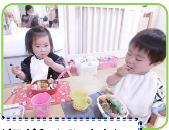
手作り弁当モグモグ食べています♪